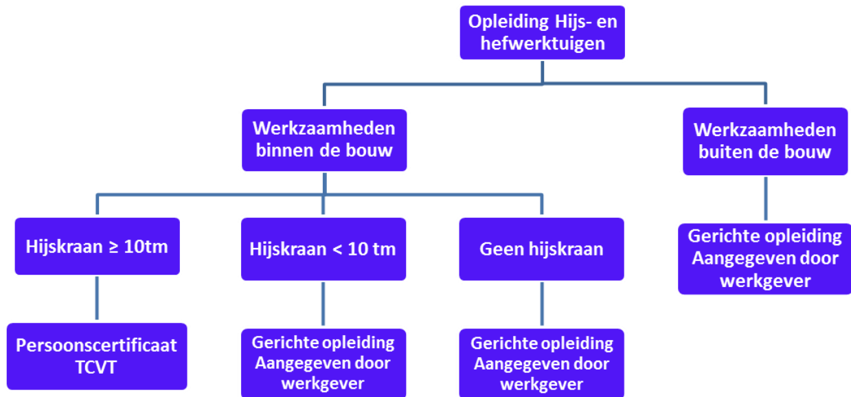
Figuur 2: Schematische weergave opleiding

Indien de autolaadkraan ook ingezet wordt voor hijswerkzaamheden binnen de bouw (Arbobesluit artikel 1.1 lid 2a en Arbobesluit artikel 7.31), dan dient volgens Arbobesluit artikel 7.32 en Arboregeling paragraaf 7.3, artikel 7.6, de machinist tenminste in het bezit zijn van een TCVT-persoonscertificaat van vakbekwaamheid machinist autolaadkraan met hijsfunctie (TCVT/W4-04, autolaadkraan (ALK) met hijsfunctie). Hiervoor bestaan er opleidingen en opleiders in de markt.